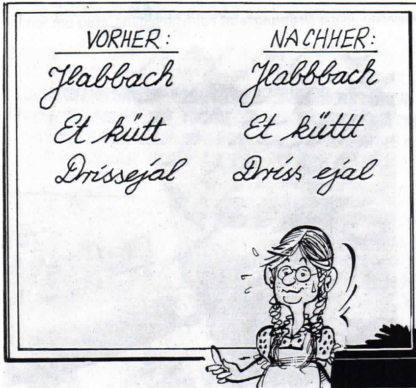
Die neue deutsche Rechtschreibung