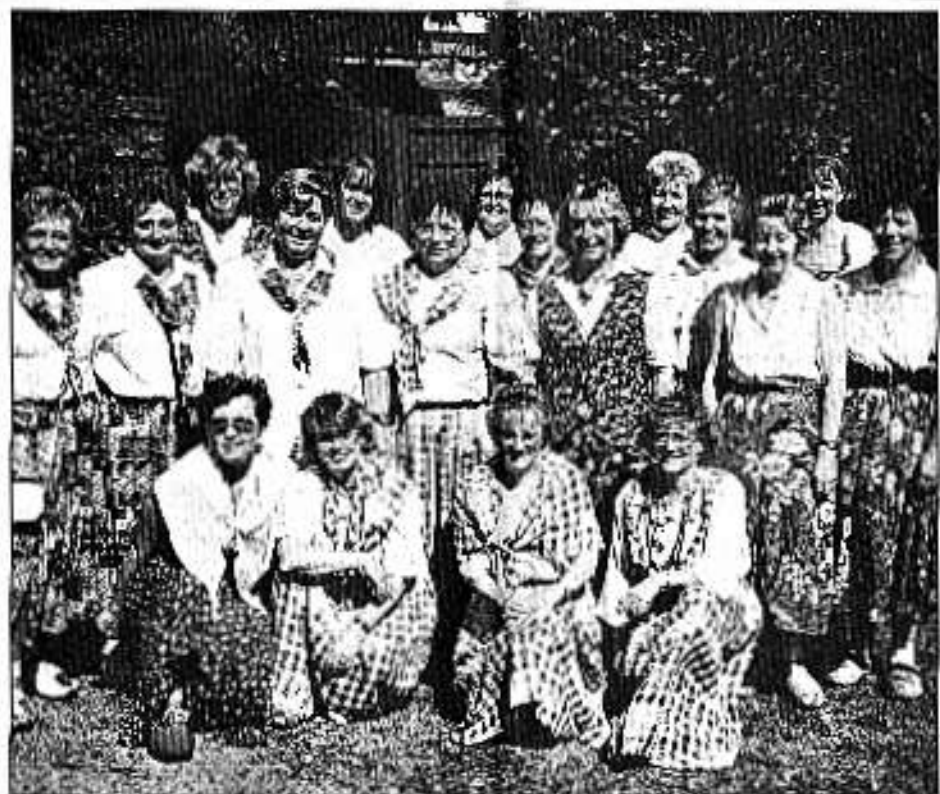
Farbenpracht bis hin zum Schuhwerk: Die kompanieübergreifende Tanzgruppe der Klompfenfrauen des Bürgerschützenvereins ist auch in diesem Jahr mit von der Schützenfest-Party.