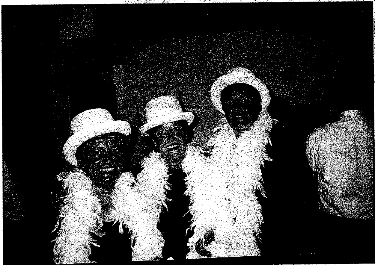
Unser Beitrag zur internationalen Tanztruppe der Klompe Ladies