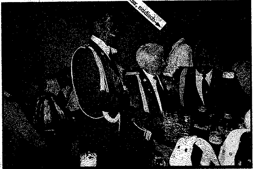
Drei, vier, jez jeht et an et Bier ...