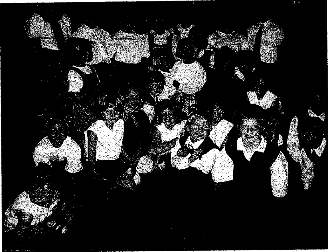
Unbestritten der Höhepunkt der Kirmes: der Rattenfänger von Hameln und die Kinder von Windberg