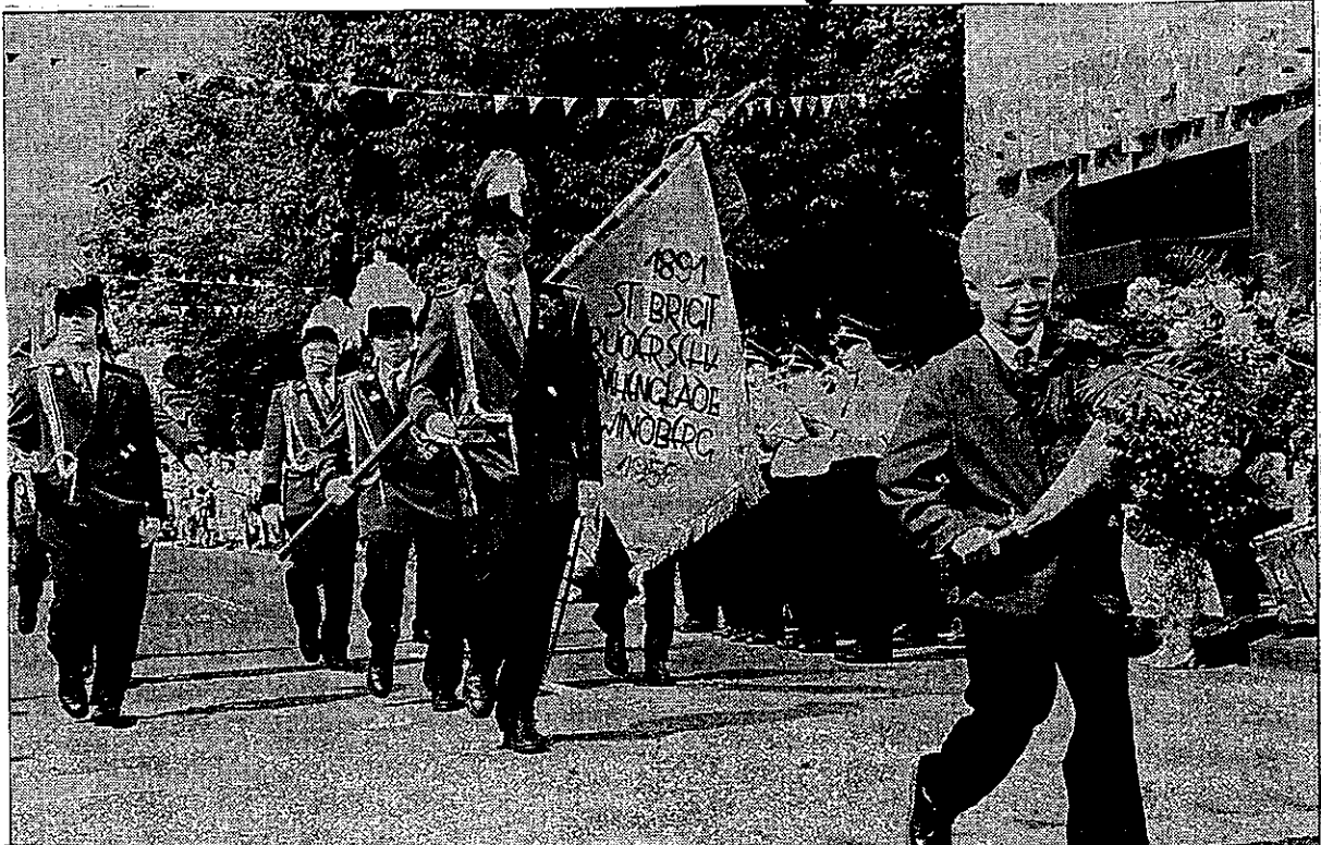
Mehr als 300 Schützen waren gestern bei der Großen Fest-Parade des Bürgerschützenvereins Windberg-Großheide angetreten: Wie man sieht, auch alle Altersstufen.